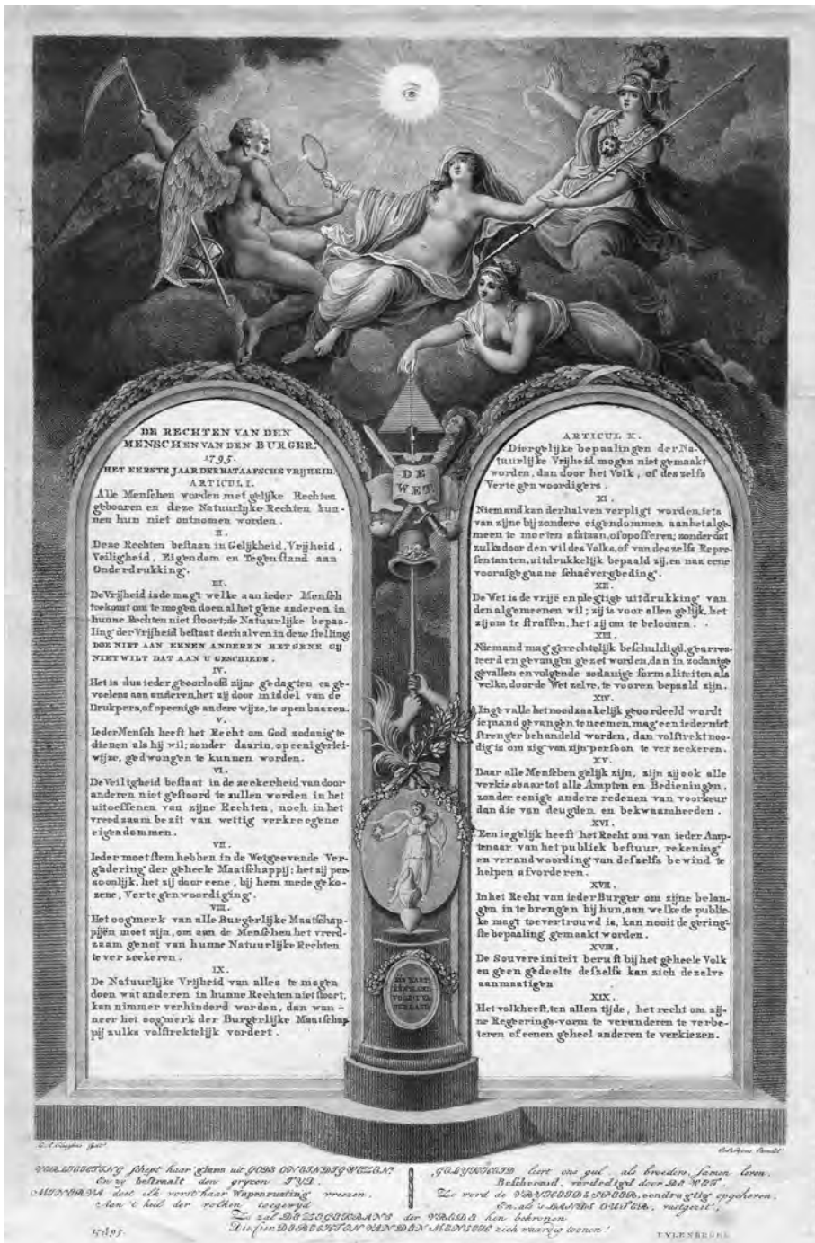
L.A. Claessens, De rechten van den mensch en van den burger. Gravure naar Frans voorbeeld, 1795. (Rijksmuseum, Amsterdam)