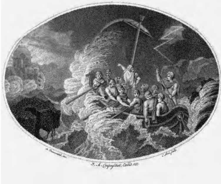
Frontispice van het weekblad De Democraten , 1797.